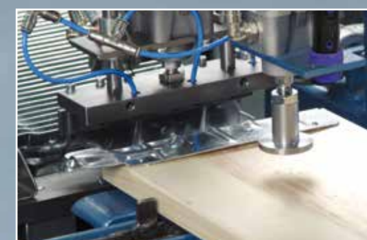
5. Узел установки петель и кассета для 70 шт.