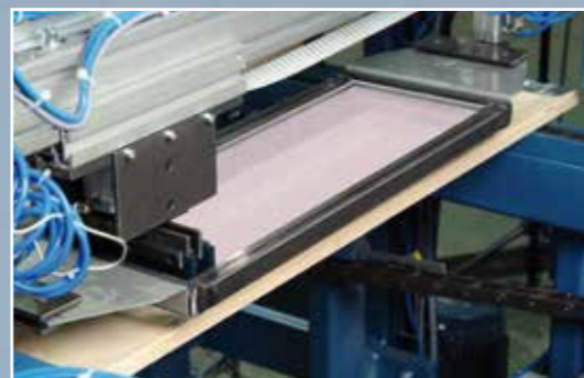
8. Узел маркировки