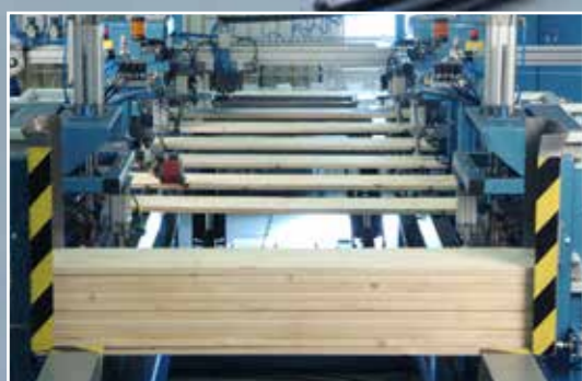
1. Кассетный штабель для 25 досок

Линия SBS 2400 производит борта очень высокого качества. Оборудование изготовлено на прочной раме с возможностью подключения дополнительных узлов для осуществления различных операций. В качестве опции можно выбрать автоматическую подачу петель, торцовку досок и другие операции. На линии можно установить стандартное ID-print оборудование, которое позволяет осуществлять на заготовках, например, логотип компании или другую информацию. Вы можете выбрать разные цвета для печати. Линия SBS 2400 проста в управлении и быстро работает. За 6 секунд происходит сверление, установка заклепок и петель, маркировка и складирование 1 детали борта.