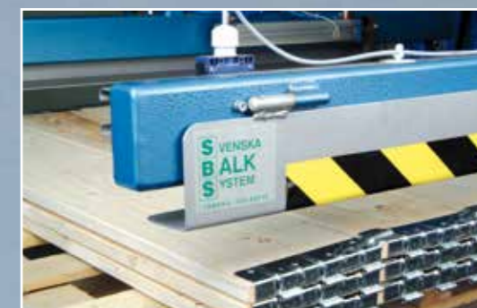
10. Штабелирование на паллету