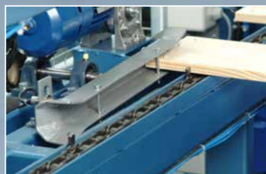
3. Автоматический переворачиватель