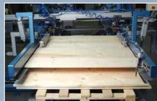
9. Система сбрасывания на паллету