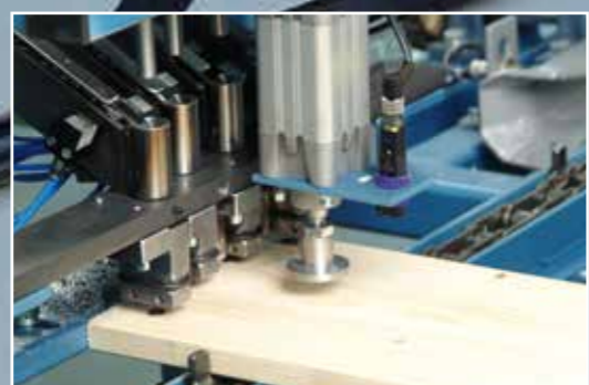
2. Узел сверления и установки заклёпок